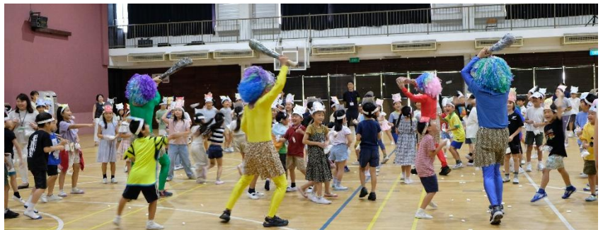
小学部1～2年生 豆まき / 鬼役はボランティアのお父さんたち