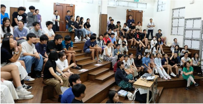
小学部6年生・中学部 節分の動画視聴