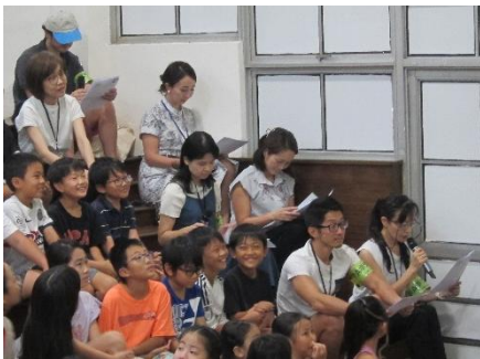
ボランティアによる紙芝居読み聞かせ