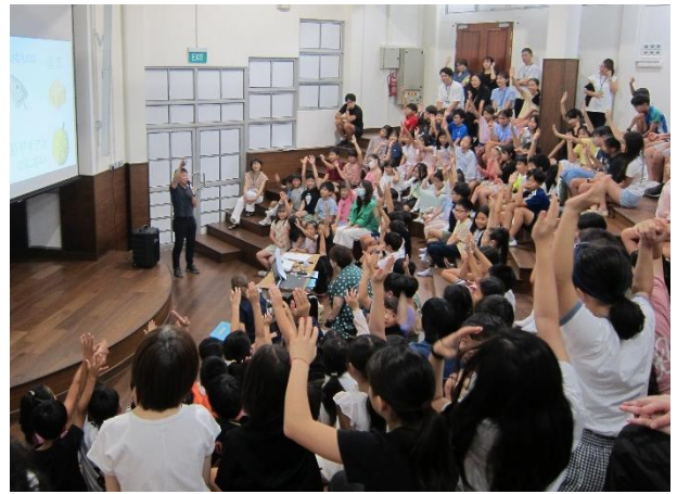
小学部3～5年生 節分の話